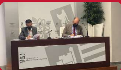
13/04. Firma Convenio Ayto. Villanueva de la Serena