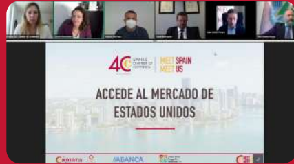
24/03. Encuentro Comercial EEUU