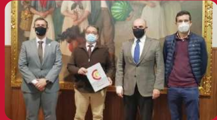
25/02. Firma Convenio Ayto. Almendralejo