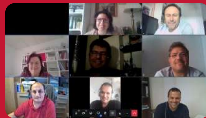
14/04. Curso Online Programa 45+