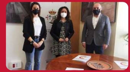
15/04. Reunión Alcaldesa Jerez de los Caballeros