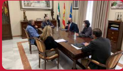
18/01 Reunión de trabajo. Ayto.de Badajoz