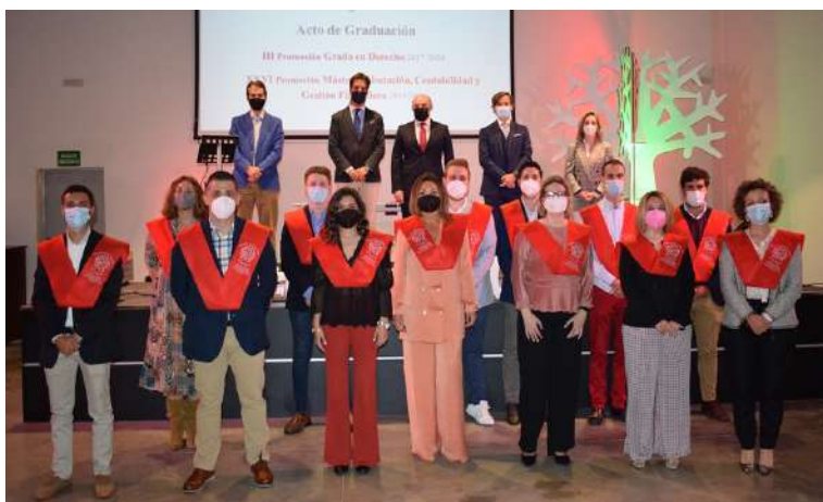
Imagen: XXVI Promoción Máster Tributación, Contabilidad y Gestión Financiera

El 15 de abril se celebró la graduación y entrega de diplomas de la tercera promoción del Grado en Derecho y de la XXVI edición de nuestro Máster en Tributación, Contabilidad y Gestión Financiera. Al acto, que contó con todas las medidas de seguridad pertinentes, acudieron alumnos y profesores; y estuvo presidido por Mariano García Sardiña, presidente de la Cámara de Comercio de Badajoz. Estas acciones formativas son dos de las más destacadas entre la oferta de nuestra Escuela de Negocios.