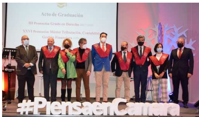
Imagen: III Promoción Grado en Derecho

Respecto a la formación online, disponemos de flexibilidad horaria, tutorías, metodología secuencial y títulos oficiales. Con Grados Universitarios en Derecho y en Administración y Dirección de Empresas, que impartimos con IMF Business School, centro adscrito a la Universidad Camilo José Cela. Te ofrecemos también Másters Universitarios online y títulos Oficiales de Formación Profesional con IMF Business School, homologado por la Comunidad de Madrid.