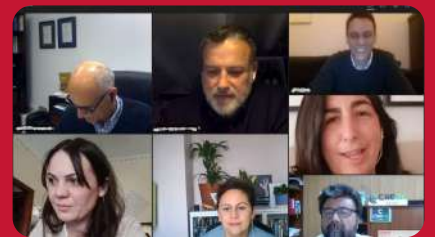
05/03. Comisión Internacionalización