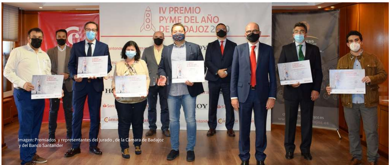
Imagen: Premiadados y representantes del jurado, de la Cámara de Badajoz y del Banco Santander