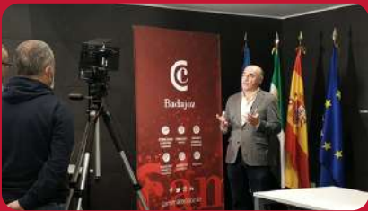
24/03. Programa Emprende TVE