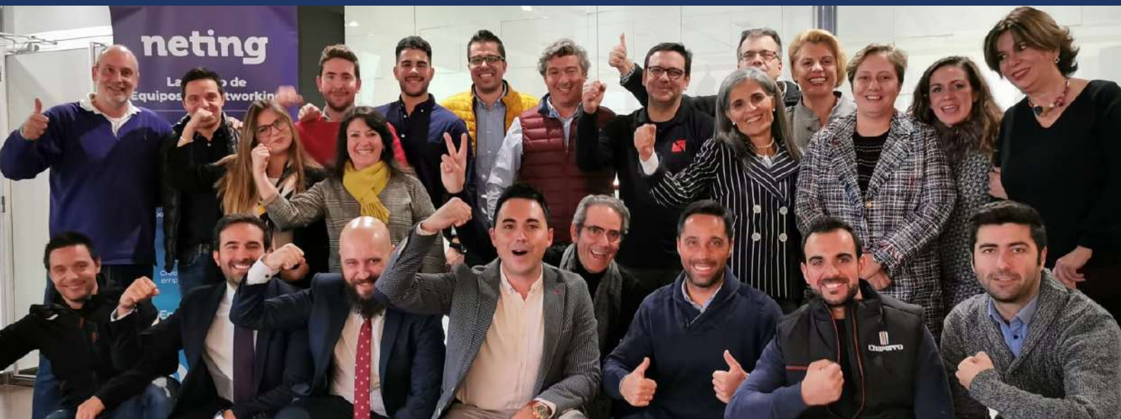
Foto de archivo previa a la COVID-19

Recibe clientes por recomendación a través de la app