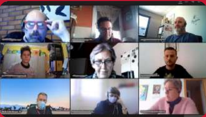
17/03. Encuentro Comercial Mmarketplace Claire