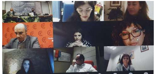
Imagen: Reunión virtual extraordinaria del Consejo de Comercio de Extremadura

En la reunión, celebrada de manera extraordinaria y presidida por el consejero de Economía, Ciencia y Agenda Digital, Rafael España, se abordaron estas cuestiones como órgano consultivo, de participación y asesoramiento en materia de comercio, y cuya finalidad es promover el desarrollo y la mejora de la actividad comercial, facilitando e impulsando la participación activa de todos los agentes implicados.