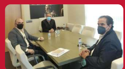
23/03. Reunión alcalde de Herrera del Duque