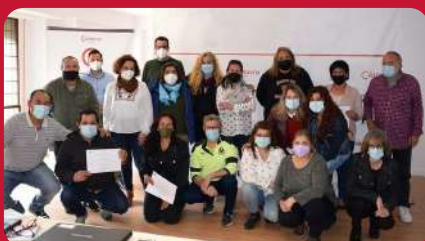
21/04. Clausura formación Programa 45+