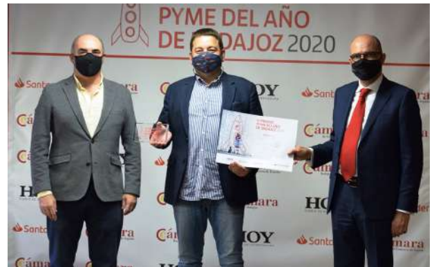
Imagen: Presidente de la Cámara de Badajoz, gerente de IAAS365 SL y director territorial del Banco Santander.

Además, del premio provincial y la mención especial, se concedieron cuatro accésits a la internacionalización (FUENSANA BIO SL), a la digitalización y la innovación (CORCHOS OLIVA S.L), a la formación y el empleo (ELECTROFIL OESTE DISTRIBUCION, SL) y a la empresa responsable (TAPIZADOS J MAYO, S.L).