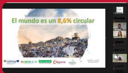
22/04. 1º Workshop REINNOVA_SI