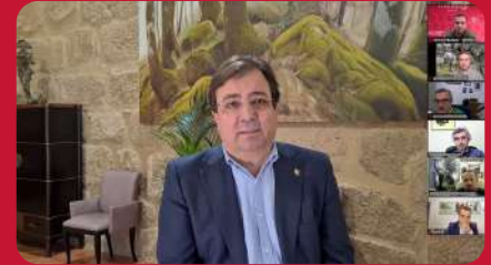
25/03. V Jornadas del Olivar y Aceite Ecológico