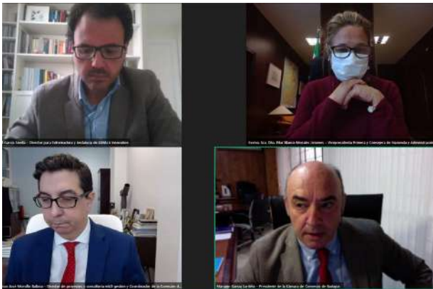
Imagen: Vicepresidenta primera y consejera de Hacienda y Administración Pública de la Junta de Extremadura, presidente de la Cámara de Badajoz, director para Extremadura y Andalucía de Zabala Innovation y director de proyectos y consultoría de MB3 Gestión.