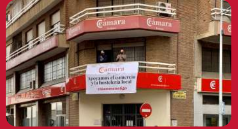
19/01. Movilización apoyo Comercio Local