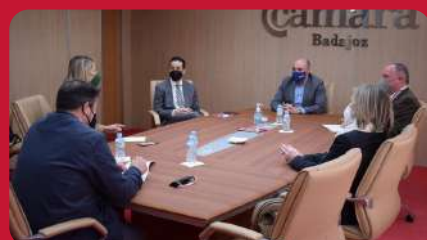
17/03. Reunión Universidad Popular