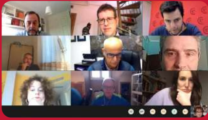
12/01. Clubinar "Conecta tu empresa II"