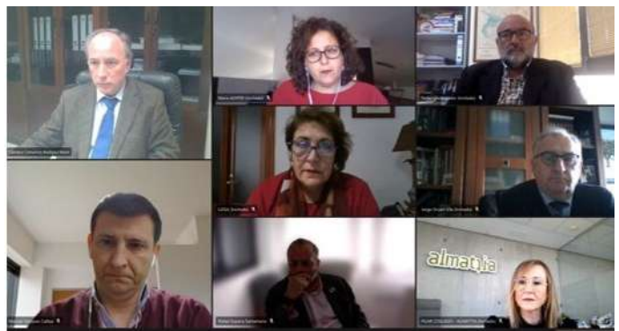
Imagen: Conexión telemática de los miembros del Pleno Extraordinario

deben sostenerse el tiempo necesario para garantizar también su solvencia y supervivencia a largo plazo”.