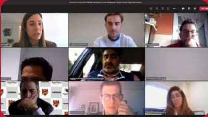
17/02. Encuentro Comercial Grupo UVESCO